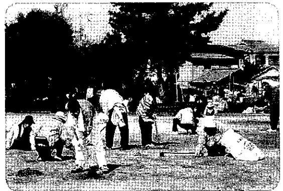
宇佐崎公園の一斉清掃

掲示物やポスターづくり、活動の様子を写真やDVDに取り込みました。作った資料は、宇佐崎の歴史として 大切に保管していきます。今後ともご協力の程、宜しくお願い致します。