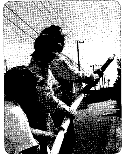
防災訓練 灘市民センター前にて

今年度も道路補修工事及び河川関係等の工事が有ると思いますので、ご理解・ご協力の程、宜しくお願い致します。