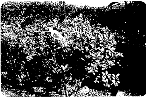
空き缶やペットボトルのポイ捨て