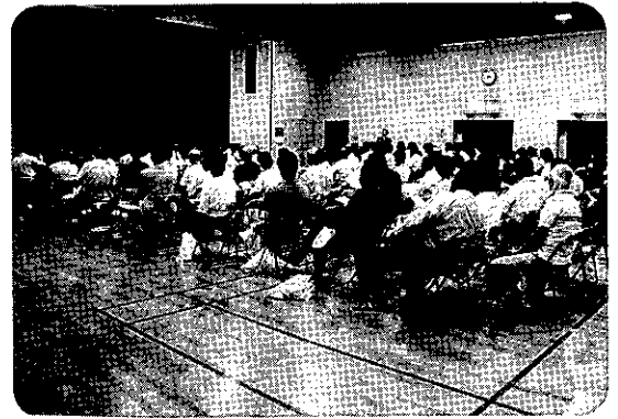
住民説明会 灘市民センターにて