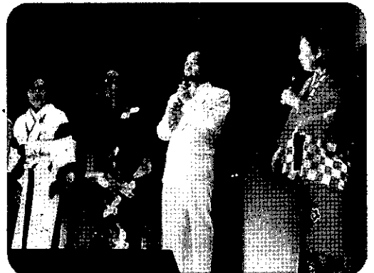
平成19年9月15日 敬老会 灘市民センター

二点共、最近、慢性化しているように思いますが、今後、いろいろ工夫を凝らしてやっていきたいと思っておりますので、皆様方の御協力を宜しくお願い致します。