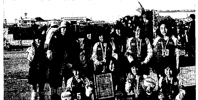
球技大会 8支部女子 バレーボール優勝!!

みんなで協力して、優勝できたから、とってもうれしかったです!かんとくや、コーチ、チームメイトに感謝しています。～なな～