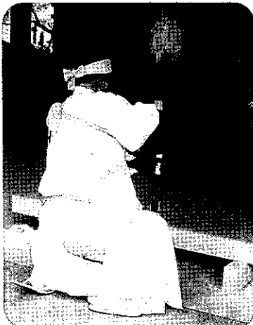
鑿入れ祭 松原八幡神社

「ええ祭りやったな」「わしら(宇佐崎)が一番やったな」と言える祭りにしたいと思いますので、多くの町民の皆さんの参加、ご協力をお願いいたします。