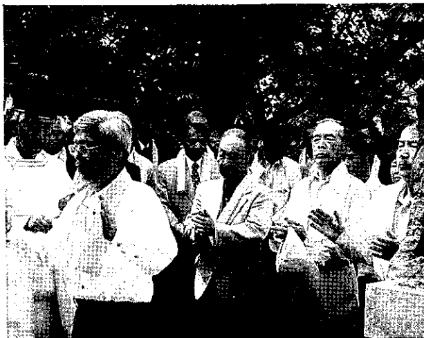
姪子神社水無月祭 高年者クラブの方々

65歳以上の方、高年者クラブにどんどん入会してください。クラブの人数によって、市の助成金の金額が桁ちがいで、限られた活動しかできません。現在102人なので150人をめざしたいと思っております。