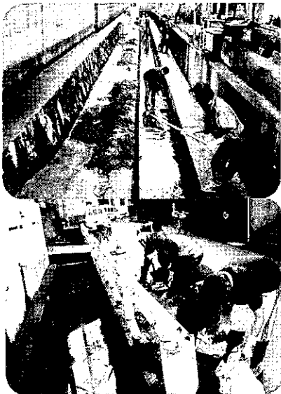
平成20年5月25日 町内一斉溝掃除