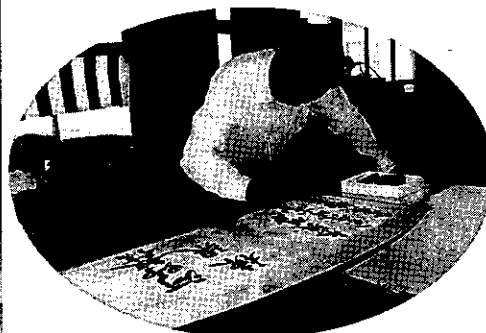
墨入れ式 河野屋台製作所