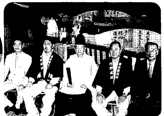
上棟式 河野屋台製作所