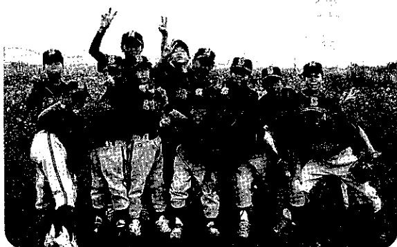
男子ソフトボールチーム

結果は、男女とも1勝1敗で残念ながら決勝には進めませんでした。元気でまとまりのあるチームで最後まで一生懸命頑張りました。とっても楽しい球技大会でした。応援してくださったみなさま、ありがとうございました。