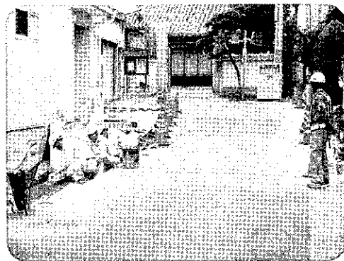
市道白浜87号線の工事

今後は国道・市道及び里道の改良工事要望書の提出、台風災害に備えて河川の維持管理を土木委員会全員で行いたいと思いますので、各委員会の役員さん、町民の皆様のご理解とご協力をお願い致します。