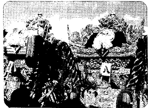
平成20年度 灘の喧嘩祭り