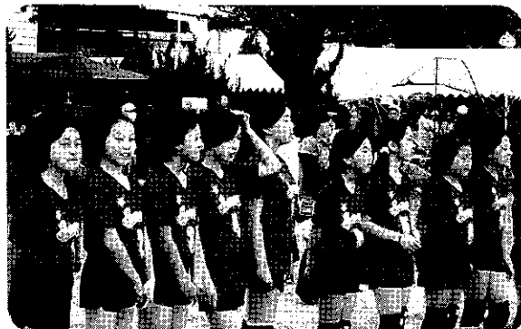
女子バレーボールチーム