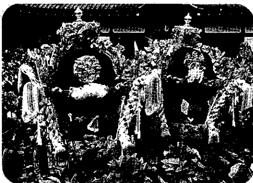
松原神社秋季例大祭

なお、懸案の屋台蔵の建設については、現在、建設場所等を検討しております。今後、皆さんからのご意見をお聞きしながら、資料館も含め屋台蔵が早期に建設できるように取り組んでまいりますので、ご理解、ご支援いただきますよう宜しくお願い致します。