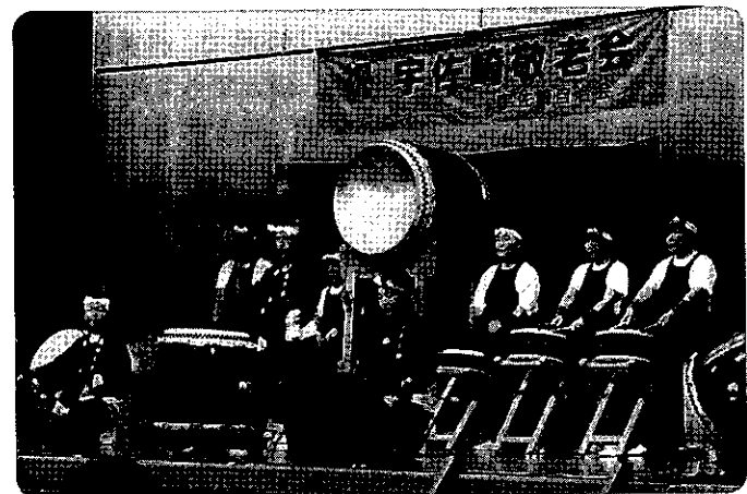
祝 宇佐崎敬老会 和太鼓