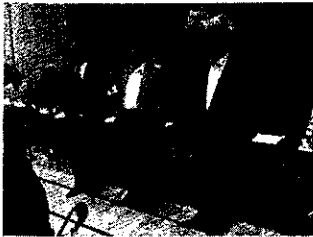
10月1日 白浜三町会議 (灘市民センター)