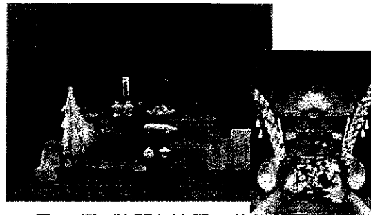
9月23日 狭間お披露目祭