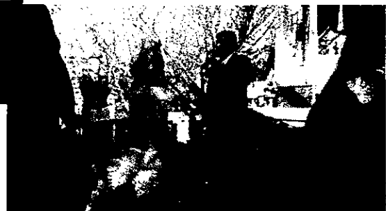
とんど・蛭子神社睦月菜祭