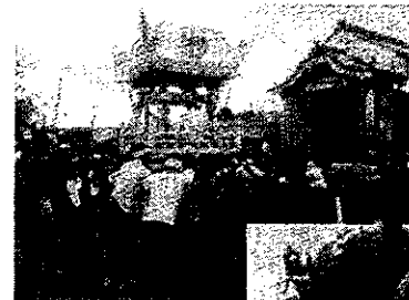
10月7日 若中練子講習会