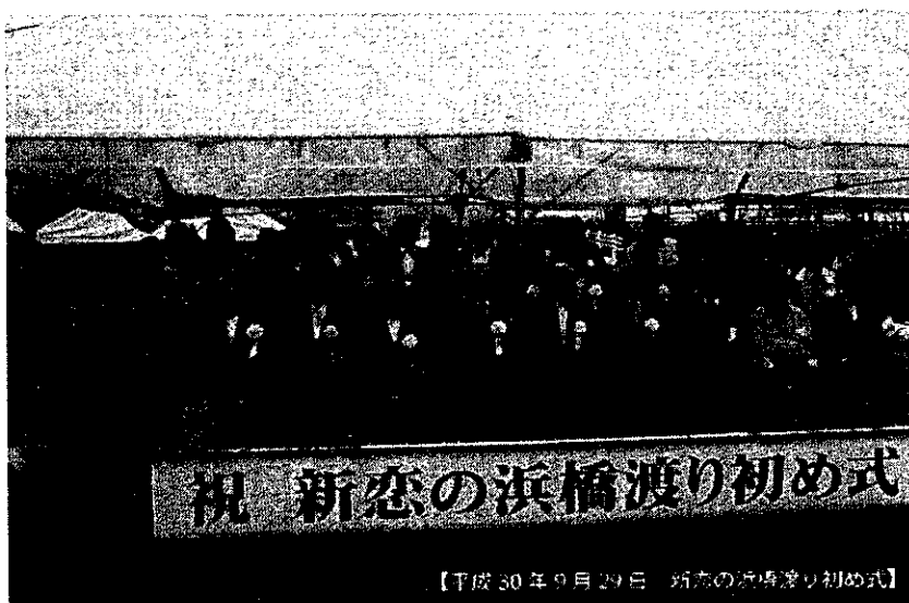
【平成30年9月29日 新恋の浜橋渡り初め式】

公園関係は、高須東公園のフェンス修理及び樹木の伐採、宇佐崎公園の樹木の剪定及び伐採、灘南緑道の西側の樹木伐採及び剪定、西ノ丁の新しい公民館東側の宇佐崎公園の整備、白浜町民グラウンドの駐車場及び照明灯の設置などの整備を行いました。その他、蛭子神社周辺、石手神社周辺、西ノ丁村中の北付近などの土地境界の立ち合いや工事開始の伴う現地確認のための立ち合いなどもありました。なお、これまでに市・県の要望書を提出しながら、工事に着手できていない箇所もありますが、これからも市・県に要望をしながら、早期に環境整備できるようにしていきたいと思います。おわりにあたりまして、風水害時における避難方法についてですが、これまでは避難勧告等が発令された場合、住民の方は避難所等（白浜小学校、灘市民センター、白浜公民館など）に立退き避難（水平避難）することが、一般的な避難行動でした。しかし、現在では、高層マンションの増加や堅牢な2階建て住宅等が一般的になってきていること、佐用町等の台風9号による豪雨水害（平成21年8月）において住民が避難中に被害にあったことなどから、平成25年7月に避難に対する考えた方が見直され、姫路市地域防災計画において自宅2階や隣接建物2階以上に屋内安全確保（垂直避難）することを避難勧告時の避難行動として位置づけられました。なお、詳細につきましては、平成30年（2018年）11月に各ご家庭に「避難所マップ付（保存版）姫路市の皆様のための防災タウンページ」が配付されていることと思いますので、各家庭でご確認をお願いしたいと思います。また、自治会といたしましては、白浜小学校など「指定緊急避難場所」に加え、宇佐崎地区における一時避難所の確保に向けて、検討をしていきたいと思っておりますのでよろしくお願いいたします。