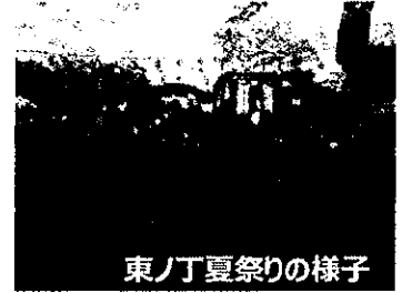
東ノ丁夏祭りの様子