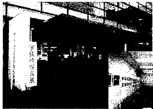
11月18日 宇佐崎写真展