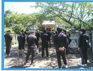
6月7日 蛭子神社水無月祭 (四役、町委員、取締三役)