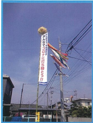
5月2日 打倒コロナ幟 建立