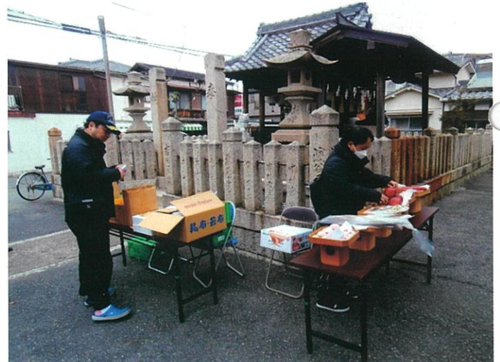
令和4年12月11日 西ノ丁 大歳神社例大祭