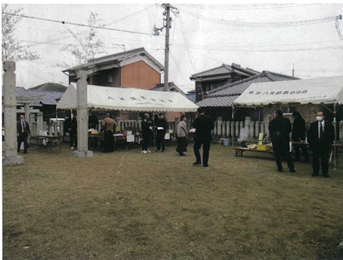
令和4年12月4日 東ノ丁 石手神社例大祭