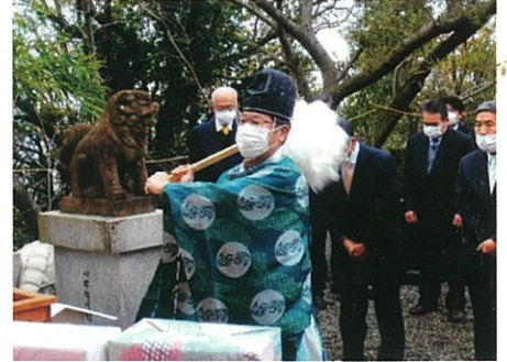
令和4年1月15日 睦月祭（福引も再開）