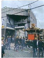
神事後、一の丸 河野建設へ納庫