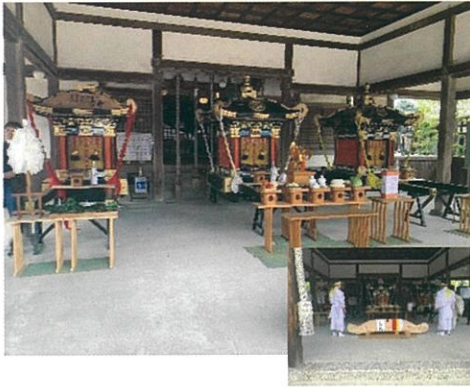
4月29日(月祝)神輿 鑿入れ神事

今年の宇佐崎練り番は、新型コロナの影響で9年ぶりとなります。さらに16年ぶりの神輿新調となり、様々な行事、神事が執り行われていきます。宇佐崎一丸となってこの栄えある練り番を盛り上げていきましょう!!