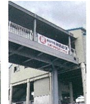
白浜の宮駅 歩道橋