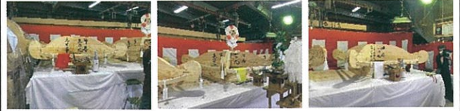
6月2日(日)神輿 上棟神事