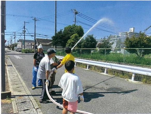
防災訓練（令和7年9月7日）