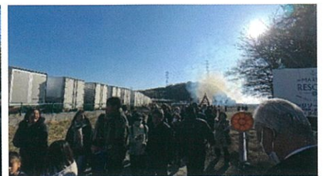
蛭子神社睦月祭・とんど（令和8年1月12日）