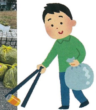
全市一斉清掃（令和7年12月7日）