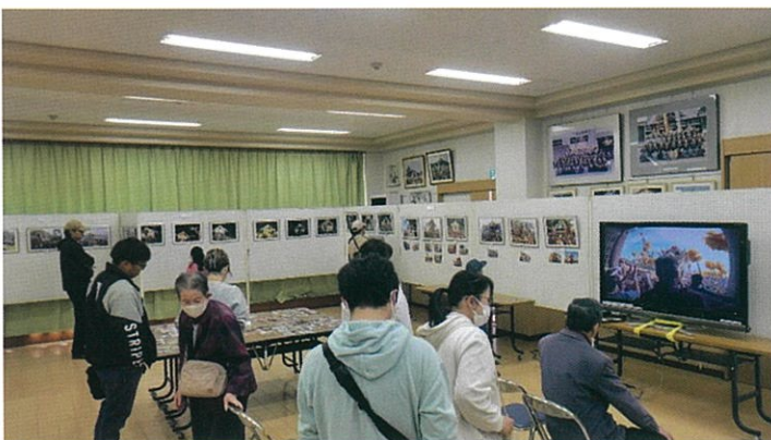
宇佐崎写真展（令和7年11月16日）