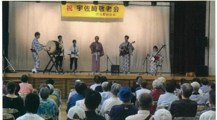
宇佐崎敬老会（令和7年9月14日）